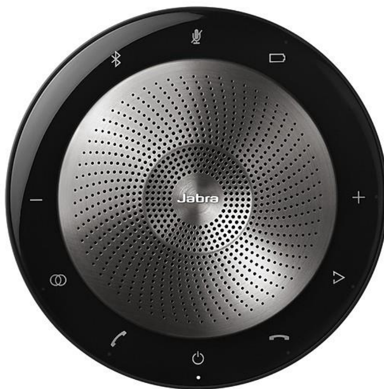
Loa tích hợp microphone

- Với điểm cầu từ 3-10 người hoặc lớn hơn nên có các thiết bị họp chuyên dụng như hệ thống loa tích hợp mic nối tiếp, Webcam, Tivi để trình chiếu. Tư vấn loa Jabra Speak 710MS, Logitech Webcam BRIO 4K Ultra HD, tivi từ 50 inch trở lên. Tùy vào mức đầu tư có thể đầu tư thiết bị tốt hơn;